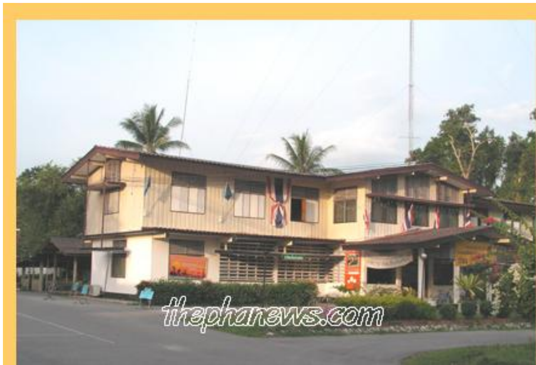
ที่ว่าการอำเภอเทพา พ.ศ.๒๕๑๖

จากหลักฐานสำเนาพระราชหัตถเลขาของพระบาทสมเด็จพระจุลจอมเกล้าเจ้าอยู่หัวฉบับที่ ๓ เป็นหลักฐานให้นายธำรง ถึงสุข นายอำเภอเทพาได้นำเรื่องทูลหม่อมเจ้าทองคำเปลว ทองใหญ่ ผู้ว่าราชการจังหวัดสงขลาขอเปลี่ยนชื่อ "โรงเรียนวัดเทพาไพโรจน์" แต่เดิมชื่อวัดพระสามองค์ เปลี่ยนในสมัยหม่อมเจ้าทองคำเปลว ทองใหญ่ ตามหนังสือที่ จ.สงข ๐๐๒/๖๘๑ ลงวันที่ ๑๑ พฤษภาคม ๒๕๑๔ ตามชื่อวัดที่พระราชทานในรัชกาลที่ ๕ ด้วยและได้รับอนุมัติเรียบร้อยเมื่อวันที่ ๑๑ พฤษภาคม ๒๕๑๔